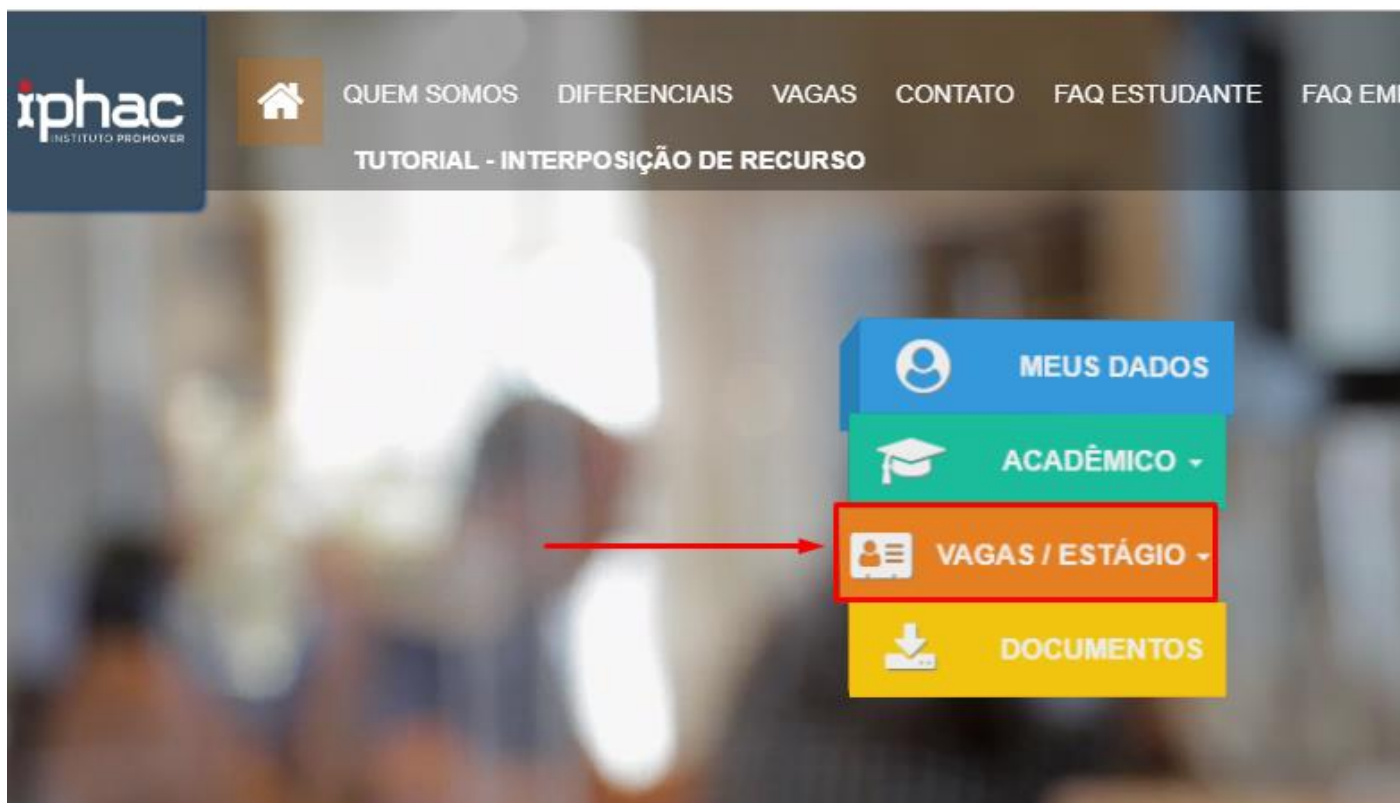
Figura 3 - Vagas / Estágio

3 – Depois de acessar o sistema, selecione a opção “ Vagas / Estágio ”.