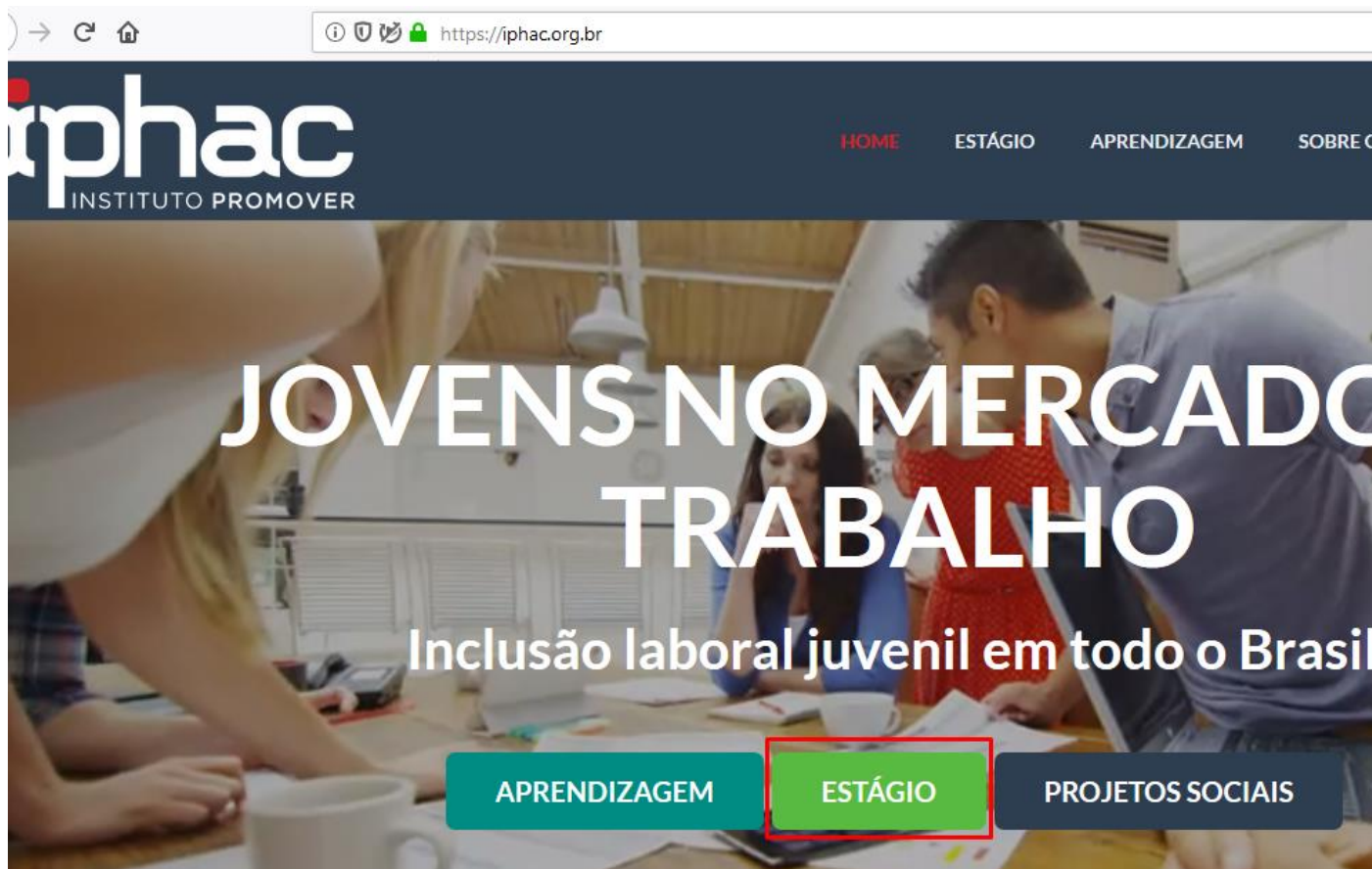
Figura 1 - Promover Estágios

1 - Para acessar o menu de recursos, acesse o site http://iphac.org.br e clique no botão “ Estágio ”, como mostra a figura: