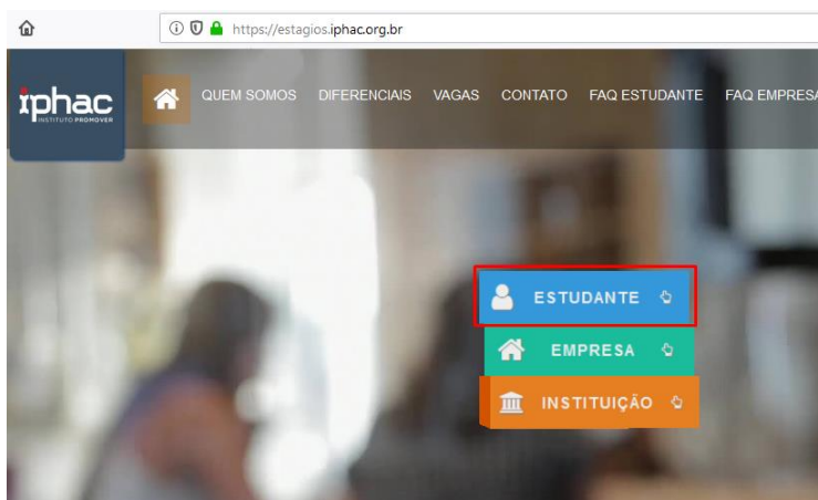
Figura 2 - Login Estudante

2 – Em seguida, faça o seu login, utilizando as mesmas credenciais utilizadas para se inscrever no Processo Seletivo da Escola Superior do Ministério Público, clicando em “ Estudante ”.